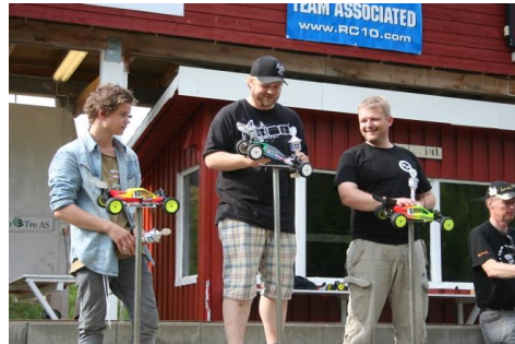
Vinnere 2WD Buggy Elektro