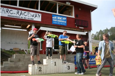
Vinnere Short Course

Innherred RC Bilklubb vil sende en takk til alle førere som deltok under helgens NC3 arrangement, og ønsk dere velkommen til oss ved en senere anledning. En takk til kioskpersonalet er også viktig å få med. De gjorde en fantastisk jobb under hele helgen. Gå inn på vår hjemmeside www.ihrc.no for mer informasjon om neste løpsarrangement og andre opplysninger.