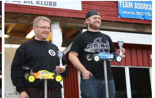
Vinnere 4WD Buggy Elektro