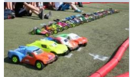
Oppstilling av alle deltagere og biler i Short Course og 1:10 2WD

Dommere og løpsleder gir og har mottatt mye positive tilbakemeldinger i løpet av helgen. Løpene har igjen gått knirkefritt for førerne, og det er de som er i fokus på en slik helg. Vi takker alle i klubben som både før og etter løpet bidro med mye