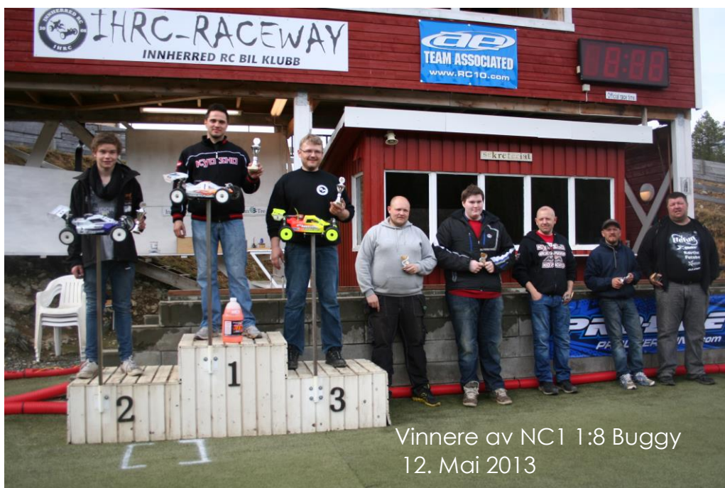
Vinnere av NC1 1:8 Buggy 12. Mai 2013